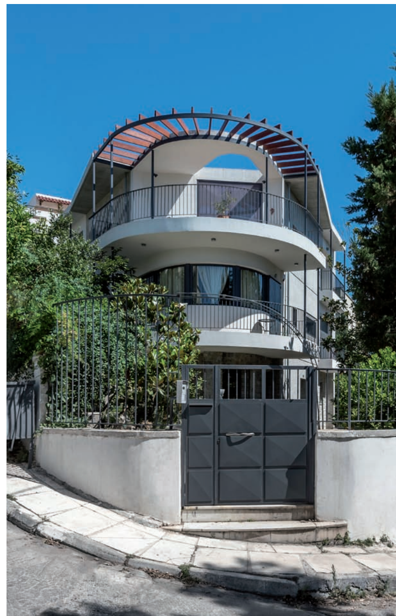
Η ΝΕΑ ΔΙΑΜΟΡΦΩΣΗ ΤΩΝ ΟΨΕΩΝ ΤΗΣ ΚΑΤΟΙΚΙΑΣ. © ΓΙΩΡΓΟΣ ΣΦΑΚΙΑΝΑΚΗΣ