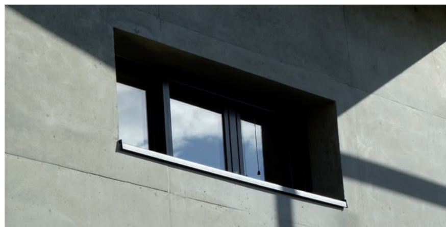
ΛΕΠΤΟΜΕΡΕΙΑ ΤΟΥ ΚΑΛΟΥΠΩΜΑΤΟΣ ΤΟΥ ΤΟΙΧΙΟΥ.