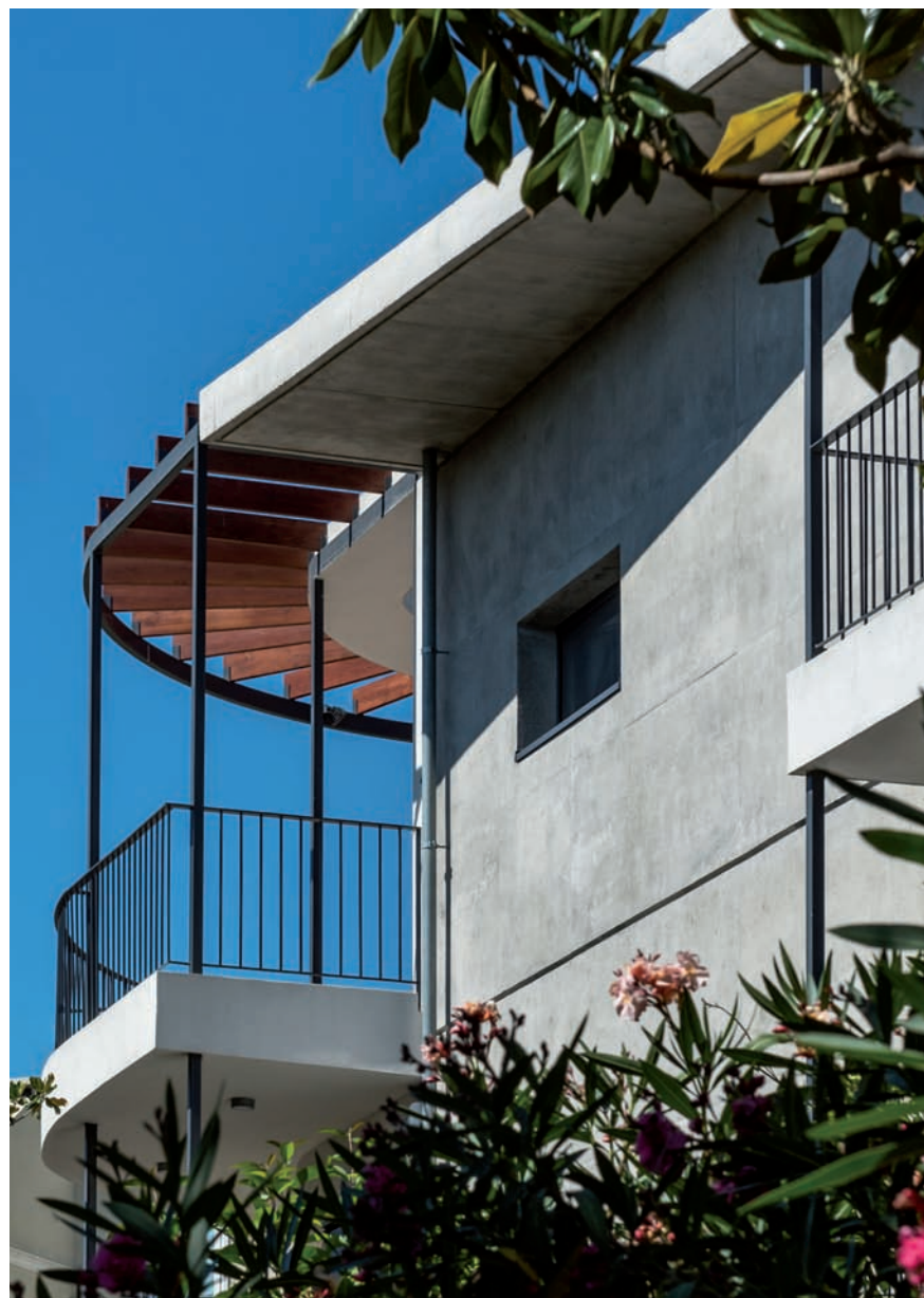
ΤΑ ΕΞΩΤΕΡΙΚΑ ΤΟΙΧΙΑ ΕΝΙΣΧΥΣΗΣ ΑΠΟ ΕΜΦΑΝΕΣ ΣΚΥΡΟΔΕΜΑ.

Η κατοικία στο Ψυχικό κατασκευάστηκε σε τρεις διαδοχικές περιόδους από τη δεκαετία του '50 έως και τη δεκαετία του '80. Τα βασικά ζητούμενα της παρούσας μελέτης ήταν η ενίσχυση του φέροντος οργανισμού, η αναδιάρθρωση των εσωτερικών χώρων και η διαμόρφωση των όψεων. Αποφασίστηκε να αποφευχθεί η εφαρμογή εκτοξευόμενου σκυροδέματος στο εσωτερικό, η οποία είναι η επικρατέστερη μέθοδος σ' αυτές τις περιπτώσεις, προκειμένου να μην περιοριστούν οι χώροι διαβίωσης και να μην αυξηθεί το κατασκευαστικό κόστος. Η λύση που επιλέχθηκε απαντά στα παραπάνω δεδομένα, προτάσσοντας τέσσερα εξωτερικά τοιχεία ενίσχυσης από εμφανές σκυρόδεμα, τα οποία εκτός από το δομοστατικό τους ρόλο προσδιορίζουν σε μεγάλο βαθμό και το αισθητικό αποτέλεσμα της μορφής του κτιρίου, δίνοντας επιπροσθέτως τη δυνατότητα μιας ελεύθερης εσωτερικής διαμόρφωσης.