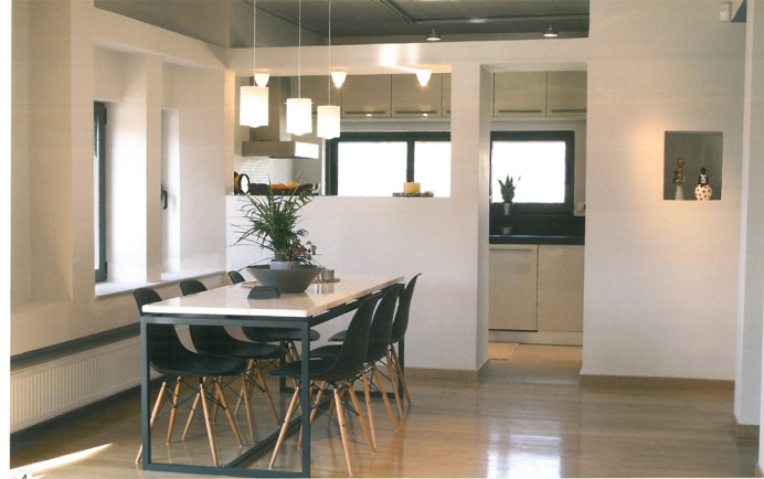
4,5 Άποψη των χώρων τραπεζαρίας - κουζίνας και καθιστικού. View of the dining - kitchen and living areas.