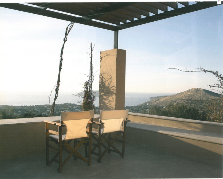
3 Θέα στα Σαρωνικά από τη νοτιοδυτική βεράντα. View towards Saronikos from the southwest veranda.